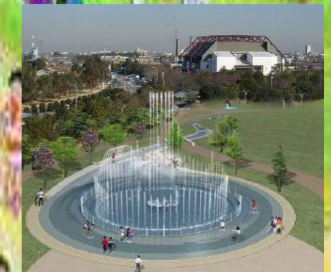
音楽とカー噴水のある臨海公園

2019年5月19日(日) 開催場所:碧南市臨海公園付設 サイクルロード(雨天決行) 10km9:30 3km9:50 } スタート 5km10:15