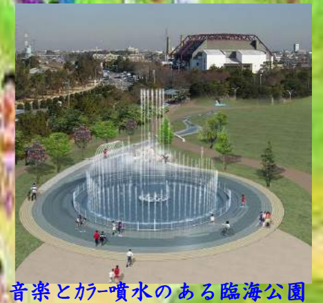
音楽とカー噴水のある臨海公園

平成30年5月13日(日) 開催場所:碧南市臨海公園付設 サイクルロード(雨天決行) 10km 9:45 3km 10:00 5km 10:30 スタート